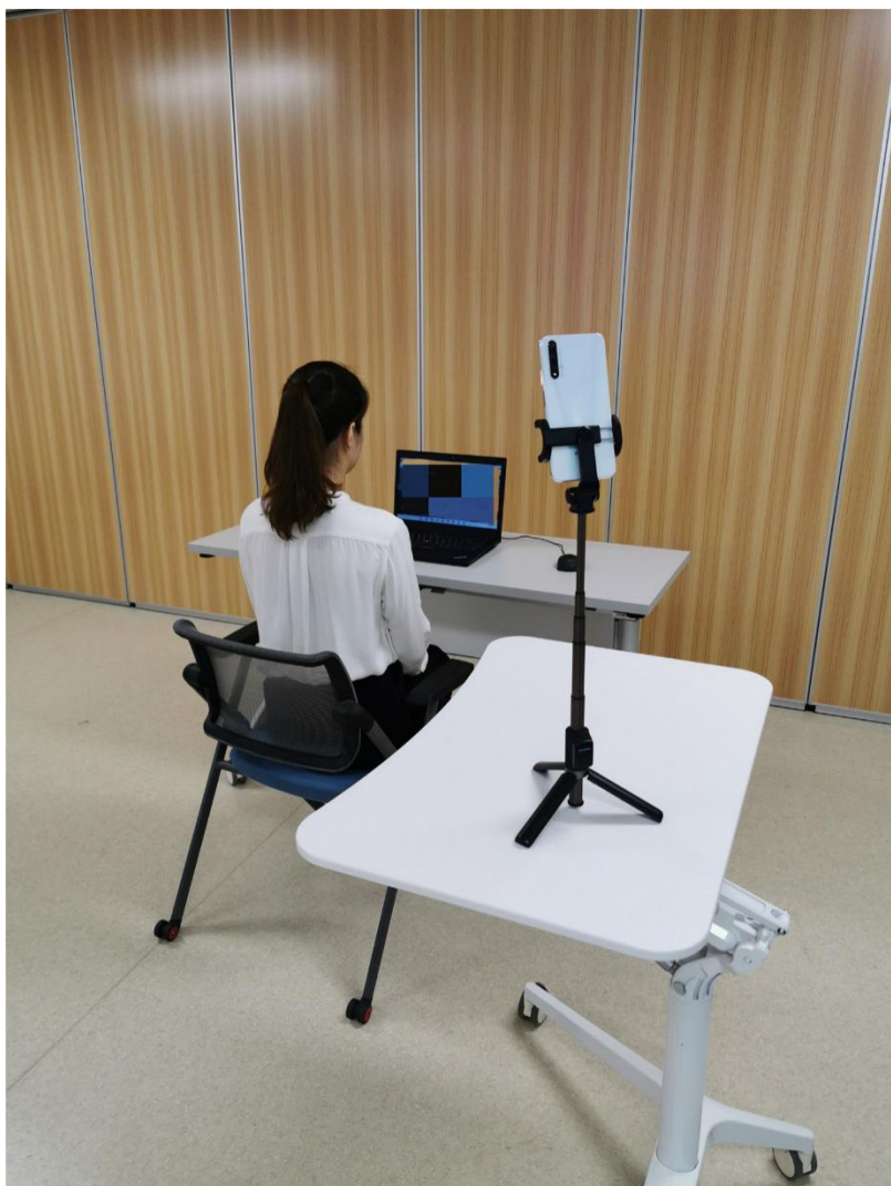
考生面试设备（含摄像头、话筒、扬声器）及侧面摄像头位置图